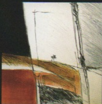
T Monotipia 13