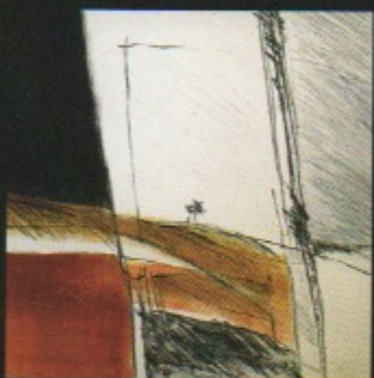
T Monotipia 13